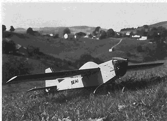
Der Viertakt-Kunstflug findet immer mehr Freunde. Die FMT hat in letzter Zeit zwei Baupläne von Kunstflugmodellen speziell für diese Kategorie gebracht, den Acron (MT 898) und die Cap 20 (MT 905), beide Wettbewerbskonstruktionen für großvolumige Motoren. Der in diesem Heft vorgestellte „Blackbird 2“ ist anders: Sehr leicht gebaut, kommt er mit einem 6,5-ccm-Viertakter aus, und wurde speziell als Trainer für diese „Viertakt-Acro-Klasse“ entwickelt

Der Rumpf kann jetzt wieder vom Helling genommen werden,