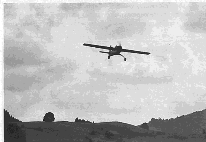
Der „Blackbird 2“ ist in der Schweiz zu Hause, in einem Land, wo die Modellflieger auch große Probleme haben. Ein schallgedämpfter 6,5-ccm-Viertakter kann aber kaum einen noch so ruhebedürftigen Eidgenossen (oder die noch ruhebedürftigeren Touristen) stören

züge. Da die Schraubenköpfe in der Balsaseitenwand versenkt werden und die Befestigung also nur an der Sperrholzverstärkung der Seitenwand hält, ist zwischen dem Lagerblock und der Seitenwand unbedingt ein Stück Glasfasergewebe einzuharzen. Die eigentliche Flügelaufgabe 32 wird jetzt reichlich mit Leim versehen und dann durch das Befestigen des Flügels auf die Seitenwände gedrückt, was eine spaltfreie Auflage ergibt. Wer Mühe mit dem Positionieren der Teile 32 hat, kann sie etwas zu groß aussägen und nach dem Trock-